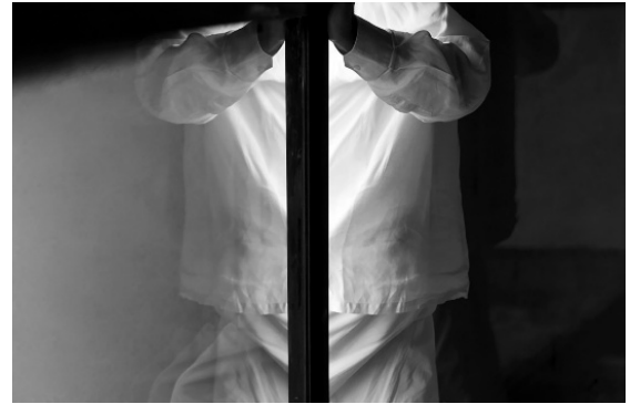
Ettore Spalletti, 2011.

17 avril – 20 juin 2026 79 rue du Temple, 75003 Paris Vernissage : vendredi 17 avril de 18 à 20h