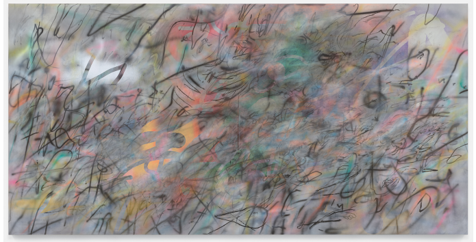
JULIE MEHRETU, A Love Supreme , 2018, ink and acrylic on canvas, 228.6 x 457.2 cm

Tacita Dean was born in Canterbury, England in 1965. She has been the recipient of various awards including the Kurt Schwitters Prize in 2009, and the Hugo Boss Prize in 2006. In 2014 she became an artist in residence at the Getty Research Institute. She is a founding member of savefilm.org and vigorously campaigns to save the medium of film. Dean lives and works in Berlin and Los Angeles.