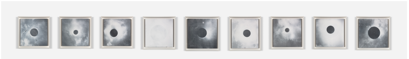
TACITA DEAN, Suite of Nine , 2018, 9 parts; spray chalk, gouache and charcoal pencil on slate, dimensions variable

For more information please contact Raphaële Coutant at 33 1 48 04 70 52 raphaele@mariangoodman.com