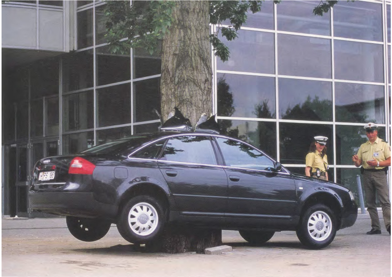
MAURIZIO CATTELAN, UNTITLED , 2000, car installation at the Expo Hannover / OHNE TITEL.

tion of European saints and pilgrims. For them, art is a coded language that allows for communication with different species: Their audience is more like St. Francis's birds than Studio 54's paparazzi. Yet never have two artists been more dissimilar from each other—one a shaman and the other a street actor and, like these characters, both sharing a fantastic amount of hypocrisy. They fight, at different levels, the formal narrative of contemporary art, and yet over and over again they are able to create sculptural visions. Their ability is in transforming revolutionary and iconoclastic energy into pure art works, while