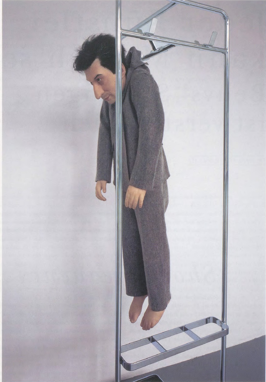
MAURIZIO CATTELAN, LA RIVOLUZIONE SIAMO NOI / WE ARE THE REVOLUTION, 2000, Migros Museum für Gegenwartskunst, Zürich / DIE REVOLUTION SIND WIR.